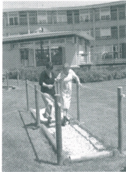
Photo : Parcours de santé en maison de retraite