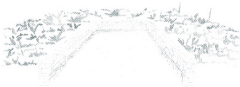
Photo : Placette d'hortithérapie (source : aquarelle Pierre-Marie Pidoux)