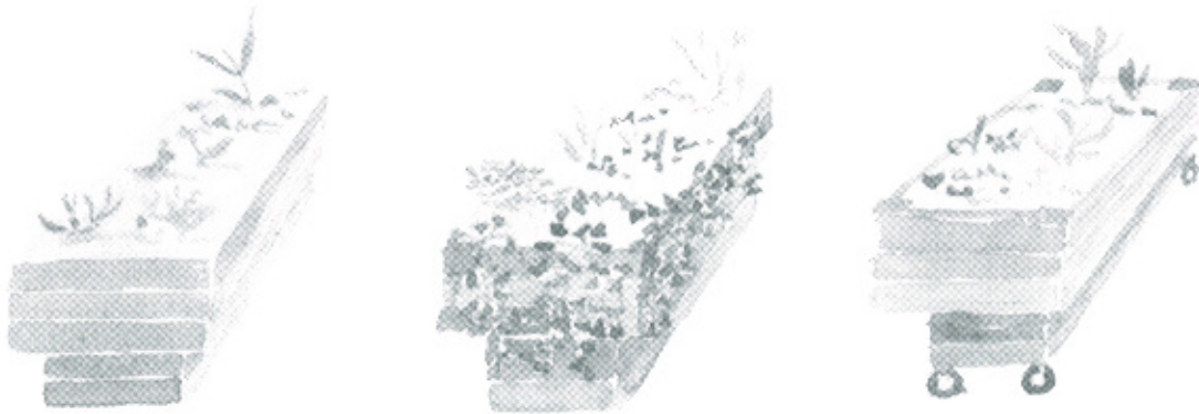
Photo : Bacs d'hortithérapie (source : aquarelles Pierre-Marie Pidoux)