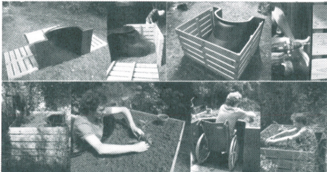
Photo : Bac de culture surélevé

Des plasticiens et des architectes réunis dans un collectif baptisé « La Valise » ont étudié dans les jardins familiaux de la prairie de Mauves (Nantes), pouvant être reprise en maison de retraite, une manière de jardiner en fauteuil roulant. Le bac de culture mesure 150 cm de largeur, 120 cm de profondeur et 80 cm de hauteur.