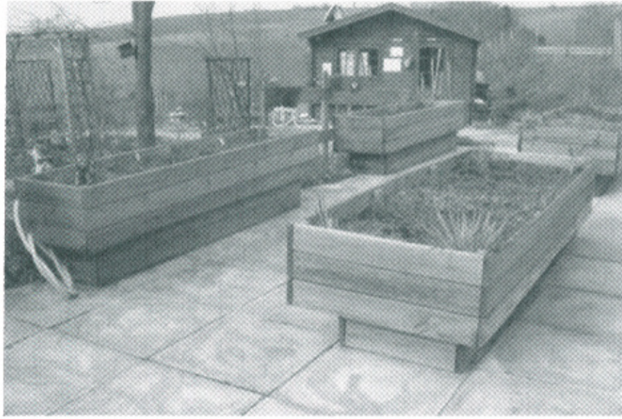
Photo : Bacs surélevés

L'hortithérapie se pratique souvent en bacs surélevés pour permettre la pratique du jardinage en position assise (fauteuil roulant) ou debout 4 .