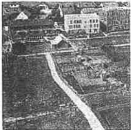
VILLE DE VAL-DE-REUIL